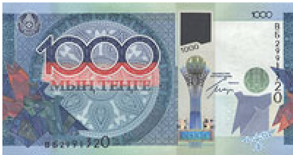
Die neue 1000 Tenge Banknote mit optisch variablem Durchsichtsfenster (schwarz in der Abbildung)

Am 5. Januar gab die Zentralbank von Kasachstan 10 Mio. Noten der neuen 1000 Tenge Note aus. Damit gedenkt die Republik Kasachstan, die mittlerweile auf 20 Jahre Unabhängigkeit von der ehemaligen Sowjetunion zurückblickt, des aktuellen Vorsitzes in der OSCE in 2010 (OSCE: Organisation for Security and Cooperation in Europe).